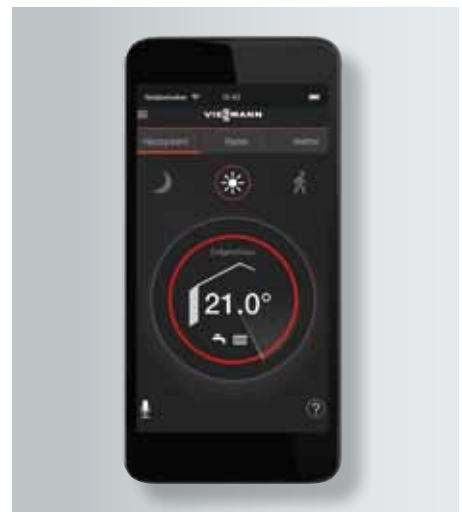
Vitotrol Plus App

Bereits ab Werk verfügt Vitodens 343-F über eine integrierte Internetschnittstelle. Per Vitotrol Plus App lässt es sich vom Smartphone oder Tablet von überall regeln. Heizgerät und DSL-Router können über ein Ethernet-Kabel direkt miteinander verbunden werden.