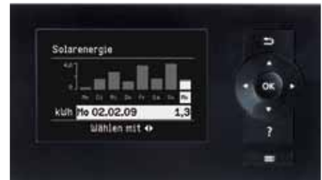
Das grafikfähige Display der neuen Vitotronic Regelung kann zum Beispiel auch den Solarertrag anzeigen

Die Vitotronic Regelung hat eine selbsterklärende Menüführung. Im Zweifelsfall genügt ein Druck auf die Hilfetaste für weitere Eingabeschritte. Die grafische Oberfläche dient auch zur Anzeige von Heizkennlinien und des Solarertrags. Das Regelungsmodul zur Ansteuerung der Solaranlage ist bereits integriert. Zum Anschluss des Temperatursensors der Sonnenkollektoren ist eine leicht zugängliche Schnittstelle vorhanden.